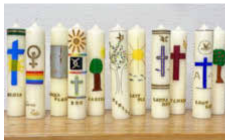
Bild der selbstgestalteten Konfirmationskerzen