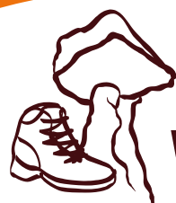
Anablick Geiersteine-Tour

Tourist-Info-Zentrum Pfälzerwald Schuhmeile 1 · 76846 Hauenstein · Tel. 06392 9233380 www.urlaubsregion-hauenstein.de