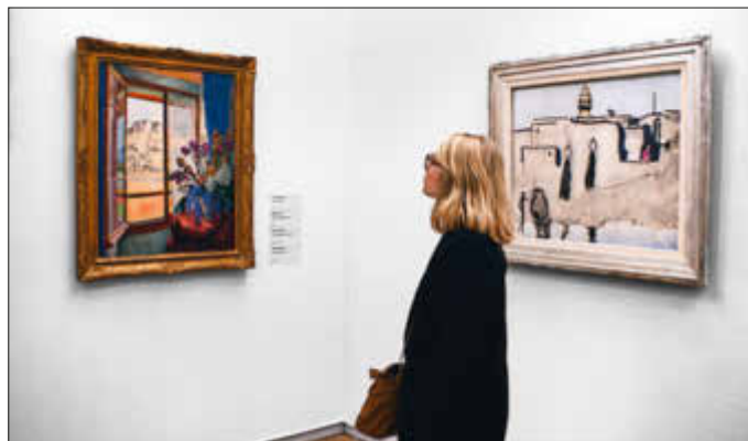
Sprachen lernen mal anders: Mit der vhs Regionalverband Saarbrücken

Verbinden Sie einen Museumsbesuch mit einer kleinen Konversationsrunde in entspannter Atmosphäre! Nachdem sich unser neues Format im letzten Semester großer Beliebtheit erfreut hat, führen wir die Reihe nicht nur fort, sondern erweitern diese noch für Sie. In unseren Kursen Französisch und Englisch im Museum erwartet Sie eine Führung, entweder in deutscher, französischer oder englischer Sprache, und eine anschließende 60-minütige Konversationsrunde auf Englisch oder Französisch, um Ihre Sprachkenntnisse auch außerhalb des gewohnten Kursraums anwenden zu können und die gewonnenen Eindrücke der Führung zu thematisieren. Grundkenntnisse der jeweiligen Sprache werden empfohlen. Das Format wird in Kooperation mit der Modernen Galerie durchgeführt und kostet pro Termin 7,00 EUR.