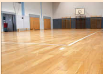
Der überarbeitete Parkettboden der Sporthalle am Grundschulstandort Fischbach-Camphausen.