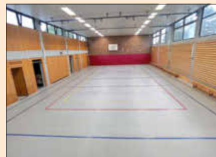
Die Mehrzweckhalle am Grundschulstandort Göttelborn hat eine neue Deckenstrahlheizung.