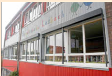
Neue Fenster mit Jalousien an der Grundschule Lasbach in Quierschied.

Darüber hinaus fanden zahlreiche Arbeiten und Anschaffungen statt, die die Standorte nachhaltig aufwerten und den Schülerinnen und Schülern, aber auch den Lehrkräften zu Gute kommen. Dazu gehören unter anderem Erneuerung der Beleuchtung hin zu mehr Energieeffizienz, die neue Deckenstrahlheizung in der Mehrzweckhalle an der Grundschule in Göttelborn, der überarbeitete Hallenboden in der Turnhalle an der Grundschule in Fischbach-Camphausen oder die neuen Fenster samt Jalousien an der Grundschule Lasbach in Quierschied.