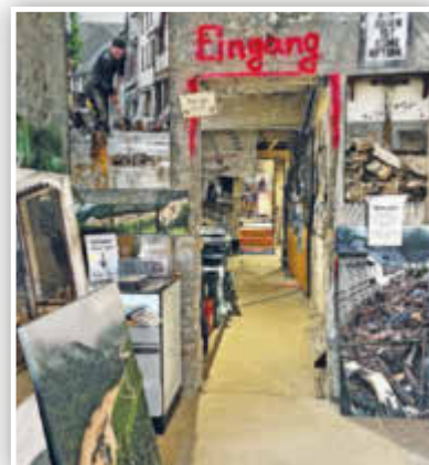
... die außer vielen Bildern auch mehrere Filmsequenzen beinhaltet.

AHRTAL. AFi. Auch fast zwei Jahre nach der verheerenden Flut ist das Ausmaß der Schäden entlang der Ahr weiterhin gegenwärtig. An vielen Stellen sieht es auf den ersten Blick noch immer nicht danach aus – doch es geht voran. Inhaber von Hotels, Restaurants und Geschäften haben, samt ihrer Mitarbeiter*innen, unzählige Stunden Arbeit, verbunden mit viel Hoffnung und Mut, in den Wiederaufbau ihrer geschäftlichen Existenzen gesteckt. Das Ziel: Endlich wieder zahlreiche Tages- und Übernachtungsgäste sowie Kundinnen und Kunden begrüßen zu können. Wanderfreudige Besucher*innen des Ahrtals dürfen sich, neben unvergesslichen Stunden in grandioser Natur entlang