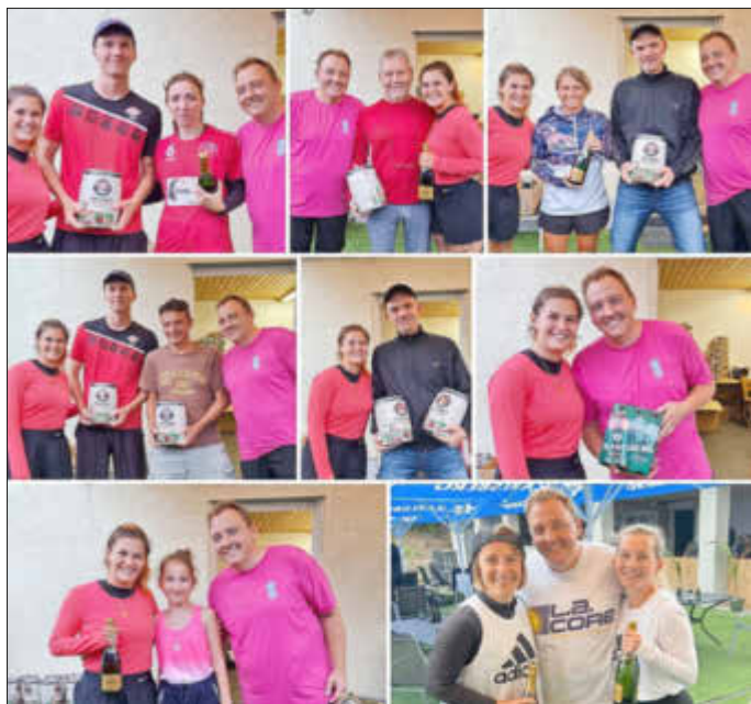
Gewinner und Gewinnerinnen des diesjährigen Hobbyturniers