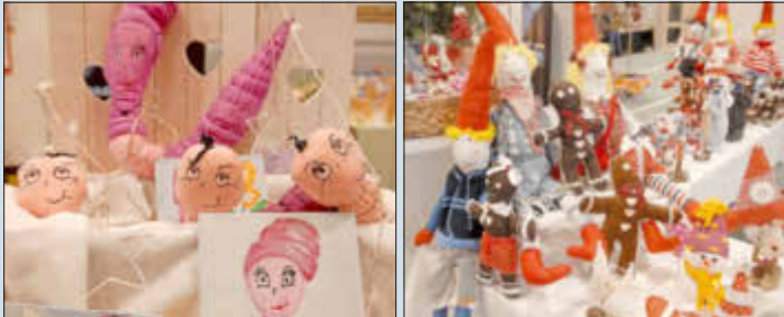
Der Kreativität und den Fähigkeiten der Ausstellerinnen und Aussteller waren keine Grenzen gesetzt.