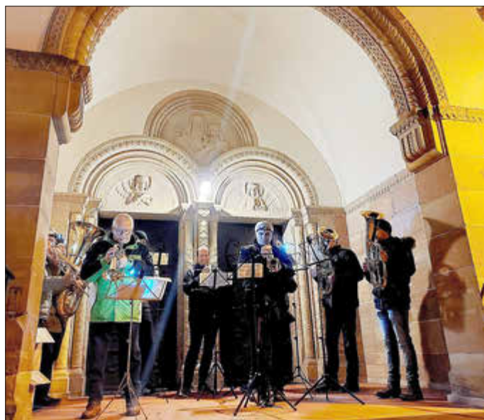
Original Fischbacher Musikanten Weihnachtsmarkt 2022

Das zweite Fenster öffnet sich am 2.12. um 14.00 Uhr auf dem Fischbacher Weihnachtsmarkt rund um die Katholische Kirche St. Josef. Auch hier wird einiges geboten; das Programm beginnt um 15.00 Uhr mit der offiziellen Eröffnung und den Darbietungen der Kinder.