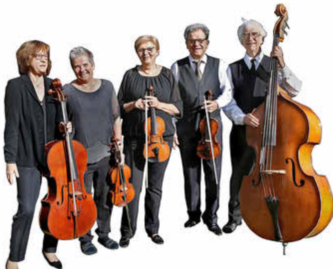
Fünf Beatles-Fans bilden das Darmstädter Beatles Streichquintett: Am 24.11. sind sie zu Gast im Saarbrücker Schloss

Während Ohrwürmer von Mozart oder Bach häufig mit Stilmitteln der Popmusik neu arrangiert werden, geht das Darmstädter Beatles Streichquintett, einen ganz anderen Weg: 180 eigene und eigenwillige Interpretationen von Beatles-Stücken haben die Hessen im Gepäck, sämtlich neu eingerichtet für zwei Geigen, Bratsche, Cello und Kontrabass.