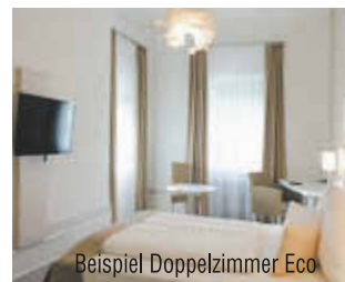
Beispiel Doppelzimmer Eco