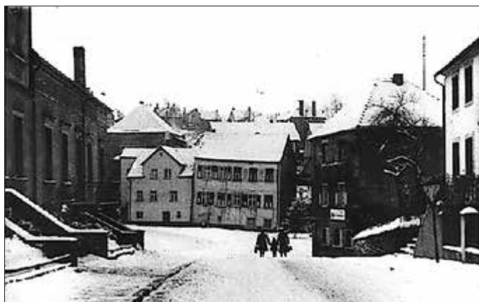
Blick vom Grubenweg auf Käsborn

Weitere Infos bei Dr. Harald Klein, Tel.: (0171) 7022129.