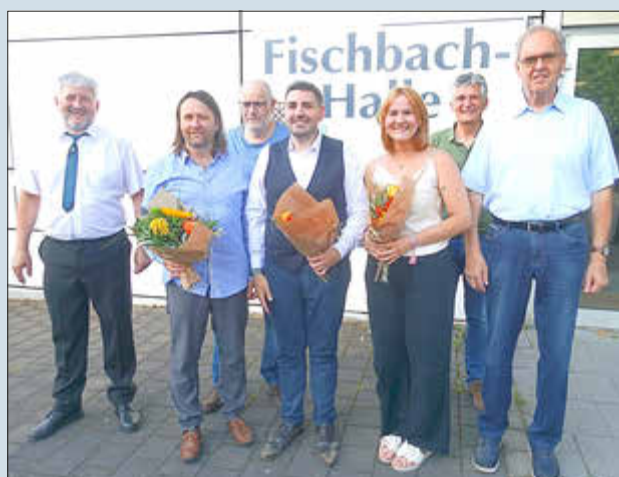
Der Ortsrat Fischbach-Camphausen nach seiner konstituierenden Sitzung.