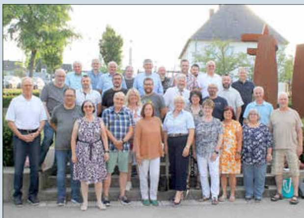
Der Gemeinderat nach seiner konstituierenden Sitzung.