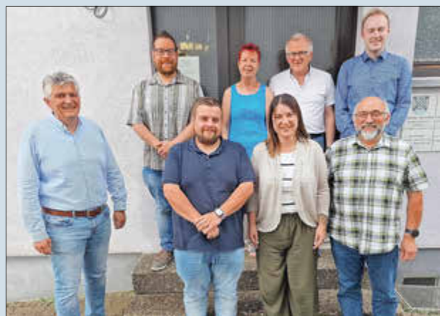
Der Ortsrat Götzelborn nach seiner konstituierenden Sitzung.