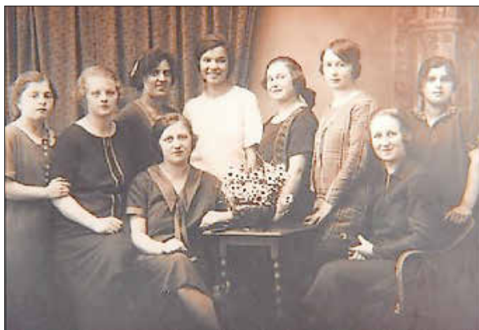
Personal Kaufhaus Levi