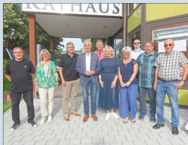
Der Ortsrat Quierschied nach seiner konstituierenden Sitzung.