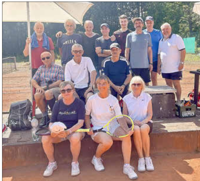
Bestes Wetter beim Turnier in der Waldparkanlage.

Obwohl der Fischbacher Tennisclub vom Hochwasser an Pfingsten arg gebeutelt war und die Plätze mit hohem Aufwand in diesem Jahr zwei Mal hergerichtet werden mussten, hat sich der Verein nicht unterkriegen lassen.