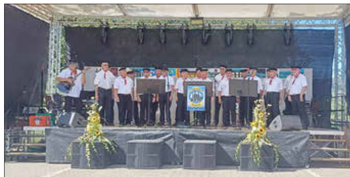
Saarshipper auf der Bühne in Reil an der Mosel

An beiden Uferseiten des Rheins begannen Böller zu krachen und zahlreiche Raketen aufzusteigen, bis wir die Festung Ehrenbreitstein erreichten. Hier erwartete uns das 30-minütige Feuerwerksfinale, das wohl bei allen einen überwältigenden Eindruck hinterließ.