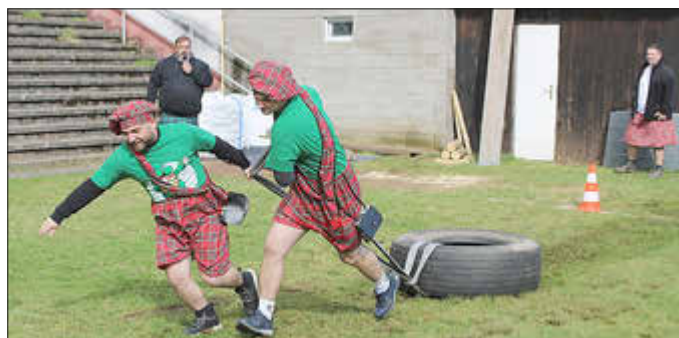
Spiele wie das LKW-Reifen-Ziehen sorgten für beste Stimmung bei den 1. „Heher Highland Games“.

Im nächsten und den folgenden Jahren soll die Veranstaltung nach Angaben der Organisatoren „weiter wachsen.“