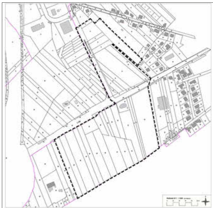
Lageplan Geltungsbereich Bebauungsplan, ohne Maßstab, genordet

Der Geltungsbereich des Bebauungsplanes ist dem folgenden Lageplan zu entnehmen: