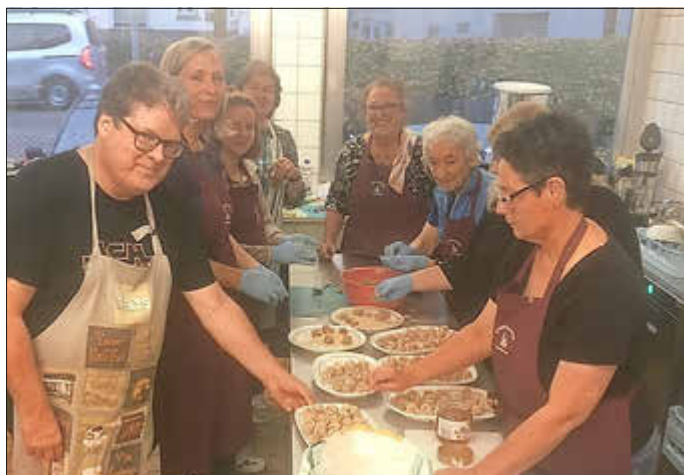
Das biblische Kochen hat Spaß gemacht und geschmeckt hat es auch!

Am 27. September feiern wir in Heusweiler, Holz und Riegelsberg Jubelkonfirmation. Eingeladen sind alle, die vor 50, 60, 65, 70, 75, 80 oder 85 Jahren konfirmiert wurden. Sollten Sie keine Einladung erhalten haben, melden Sie sich bitte im Pfarramt.