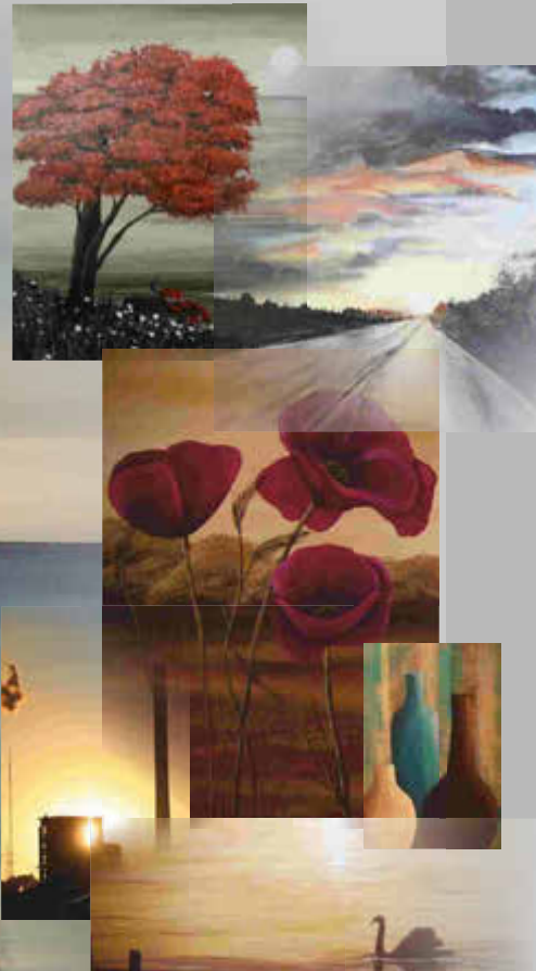
FOTO - UND GEMÄLDE AUSSTELLUNG

Ausstellung für Malerei, Zeichnungen und Fotografie