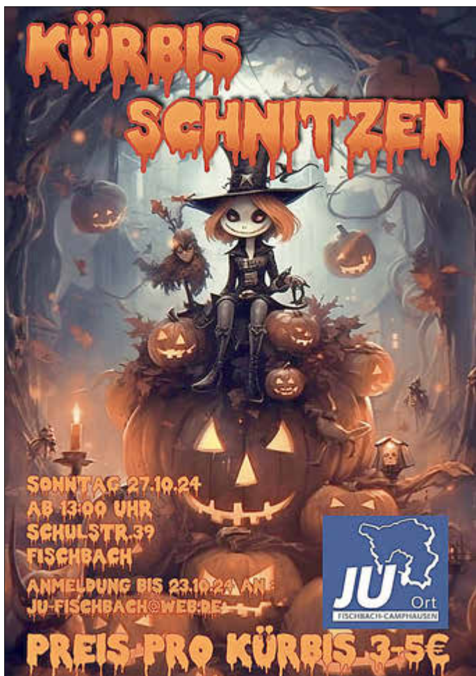
Aktion Kürbis Schnitzen 2024