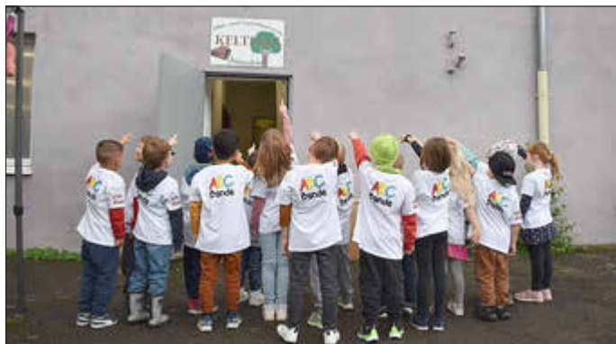
Wir bedanken uns bei den Mitarbeitern der Kelterei für diesen tollen Tag und den Einblick in ihre Arbeit.