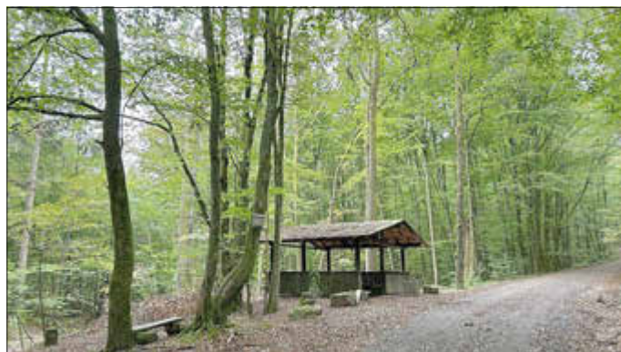
CDU-Hütte nach Baumschnitt