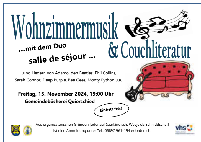
Grafik von Annette Bost

Anmeldung erforderlich unter Tel. (06897 961194) oder Mail an buecherei@quierschied.de