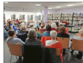
Viele Gäste genossen die wohlige Atmosphäre in der Bücherei.