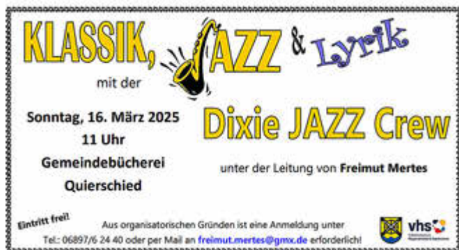
Grafik von Annette Bost

Anmeldung bei Freimut Mertes möglichst per mail an freimut.mertes@gmx.de oder unter Tel. (06897) 6 24 40 erforderlich!